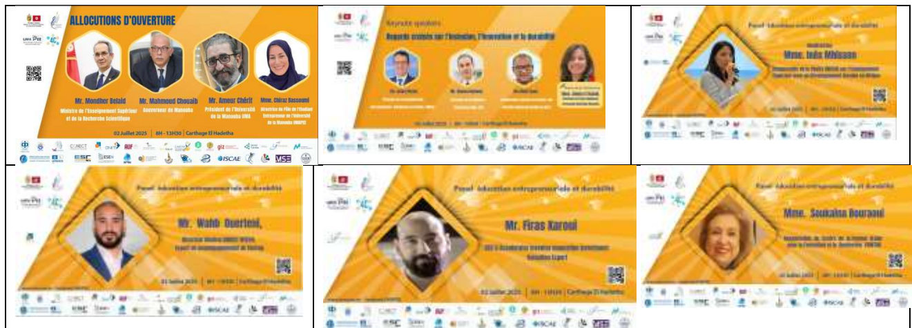
Support visuel relatif aux intervenants