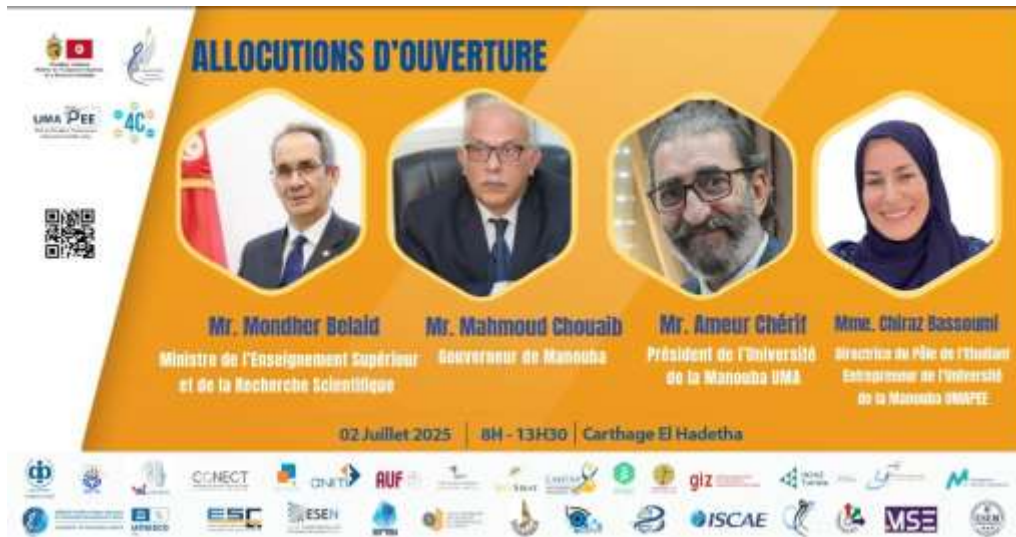
Moment de la cérémonie de remise des certificats

La remise des certificats s'est tenue à l'amphi Carthage El Hadetha, en présence des collègues, enseignants et administratifs de l'UMA.