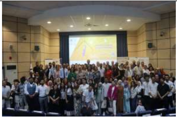
Visuel complémentaire de l'événement